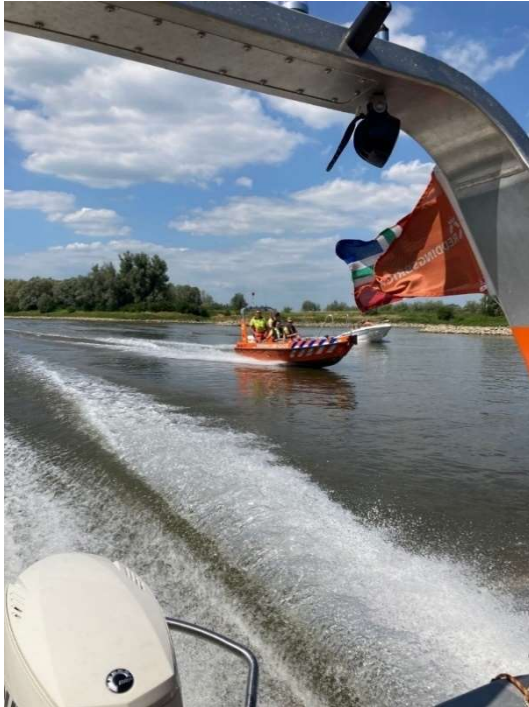
Oefening snelstromend water juni 2023